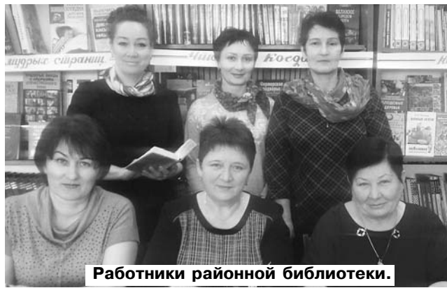
Работники районной библиотеки.